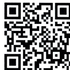
ช่างเทคนิค 3 กองพัฒนาระบบวิศวกรรม (เพศชาย)