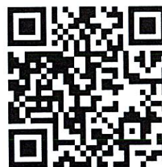
พนักงานบริการขนส่ง 3 กองขนส่ง สาขาโรจนะ