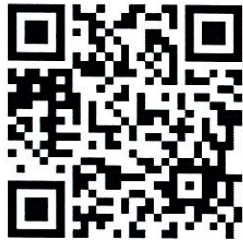
พนักงานปฏิบัติการช่าง 2 กองซ่อมบำรุงเครื่องจักร (เพศชาย)