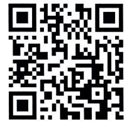
พนักงานปฏิบัติการช่าง 2 กองชิ้นส่วนอะไหล่และอุปกรณ์ (เพศชาย)