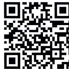
พนักงานปฏิบัติการผลิต 2 กองผลิตกั้นกรอง กองมวนและบรรจุ