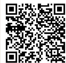
QR code for the forms (Ror Ror.1 - Ror Ror.4)